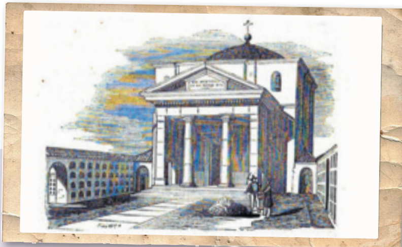
Capilla del cementerio general del Norte de Madrid.